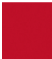
Velocity crvena Mica (27A)